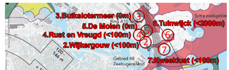
Volkstuinen bij Ring A10 Noord

Wij willen geen windturbines in ons groen en naast onze woonwijken of volkstuinen! Teken daarom de petitie en laat uw stem horen! www.windalarm.amsterdam/volkstuinen